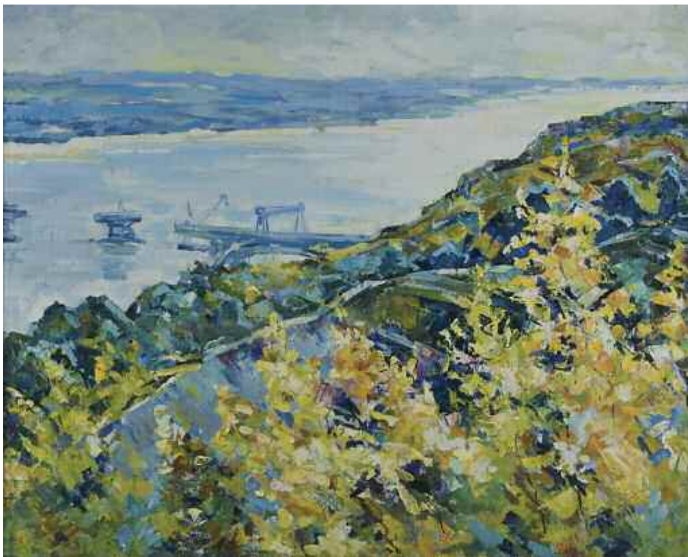
ГЛУЩЕНКО О. М. «Вид на Дніпро» , II пол.ХХ ст. полотно, олія; 79 см x 98,5 см; підпис знизу праворуч