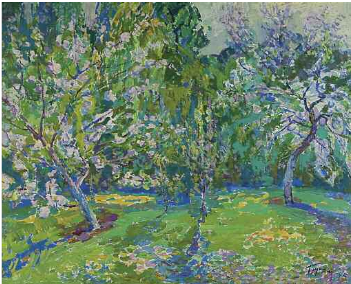
ГЛУЩЕНКО М. П. «Квітучий сад», 1975 р. картон, олія; 86 см х 104 см; підпис знизу праворуч Експертний висновок Цитовича В.І.