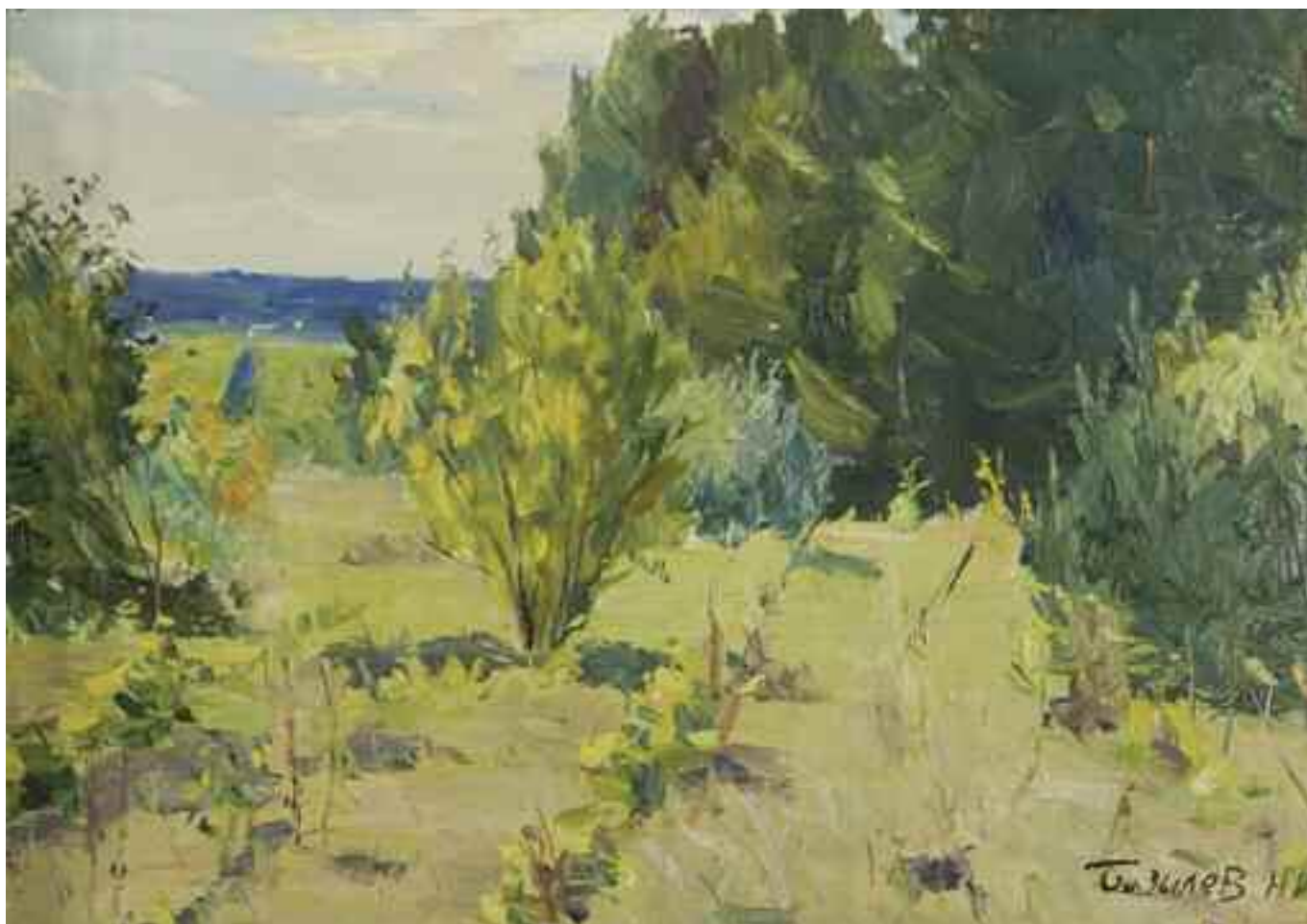
БАЗИЛІВ М. І. «Літній день», II пол. XX ст. картон, олія; 34 см x 47 см; підпис знизу праворуч