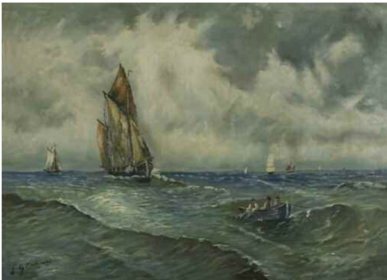
СТАХОВСЬКИЙ В. К. «На морі», I пол. XX ст. картон, олія; 51 см x 70 см; підпис знизу ліворуч Експертний висновок Распоїної В.А.