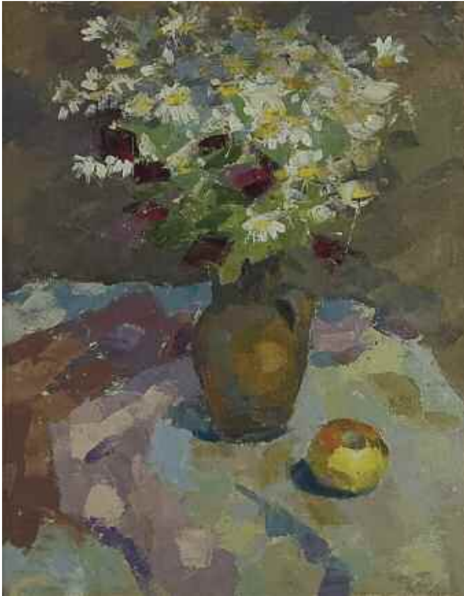
СТРЕМСЬКИЙ О. І. «Натюрморт», 1970-і рр. полотно, олія; 50 см x 40 см; підпис на звороті