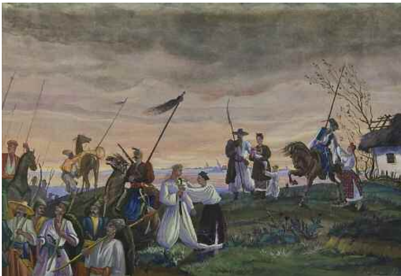
НАРБУТ Д. Г. «В похід», II пол. XX ст. папір, акварель; 41,5 см x 61 см; підпис знизу праворуч