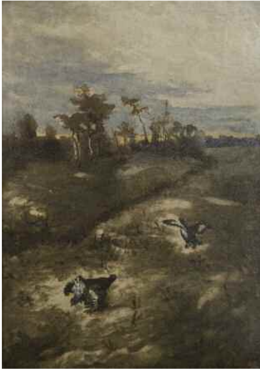
КАЧОР-БАТОВСЬКИЙ С. «Глухарі», I пол. XX ст. картон, олія; 48,5 см x 34 см; підпис знизу праворуч