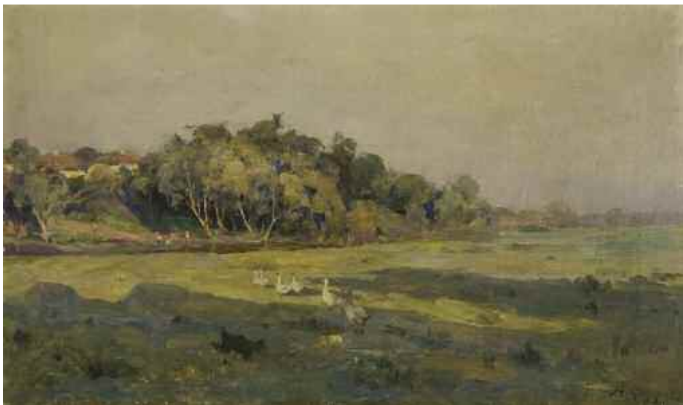
ФЕДОРОВА М. О. «Гуси на лузі», поч. XX ст. полотно, олія; 34 см x 57,5 см; підпис знизу праворуч Експертний висновок Распоїної В.А.