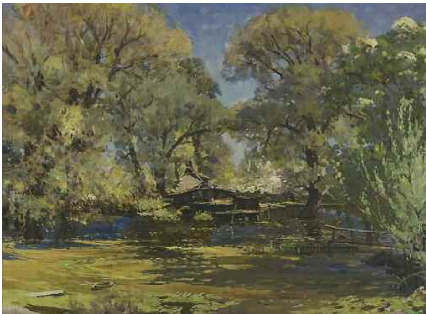
СИДОРУК В. Ф. «Пейзаж», II пол. XX ст. полотно, олія; 60 см x 80 см; підпис знизу ліворуч