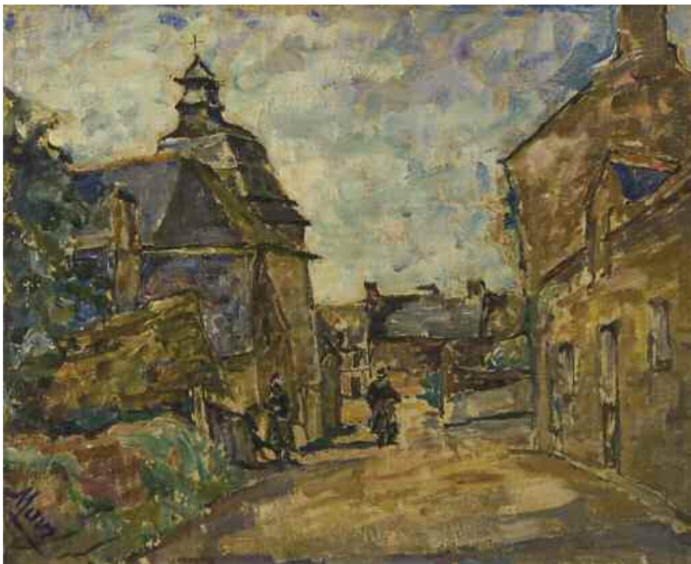
МАВРО М. «Краєвид», I пол. XX ст. картон, олія; 38 см х 46 см; підпис знизу ліворуч