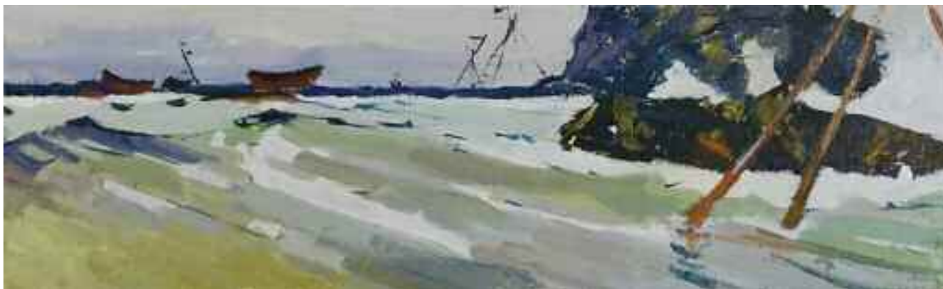
БОРТНІКОВ М. Ф. «Західний Крим», II пол. XX ст. картон, олія; 32,5 см x 87 см; підпис на звороті