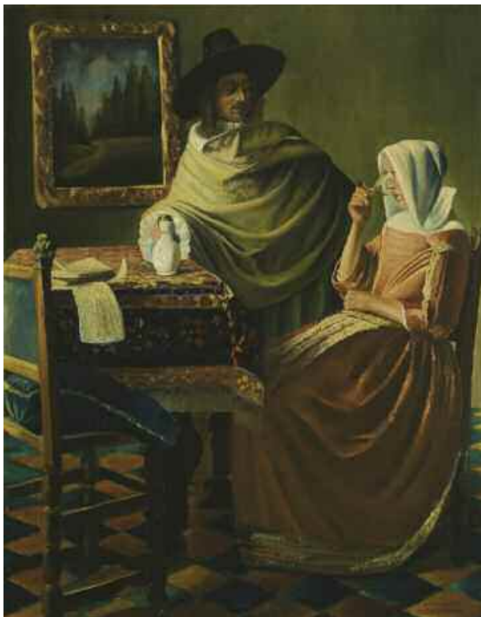
КАУФМАН Х. В. «На вечірці», поч. XX ст. картон, олія; 46 см x 38 см; підпис знизу праворуч