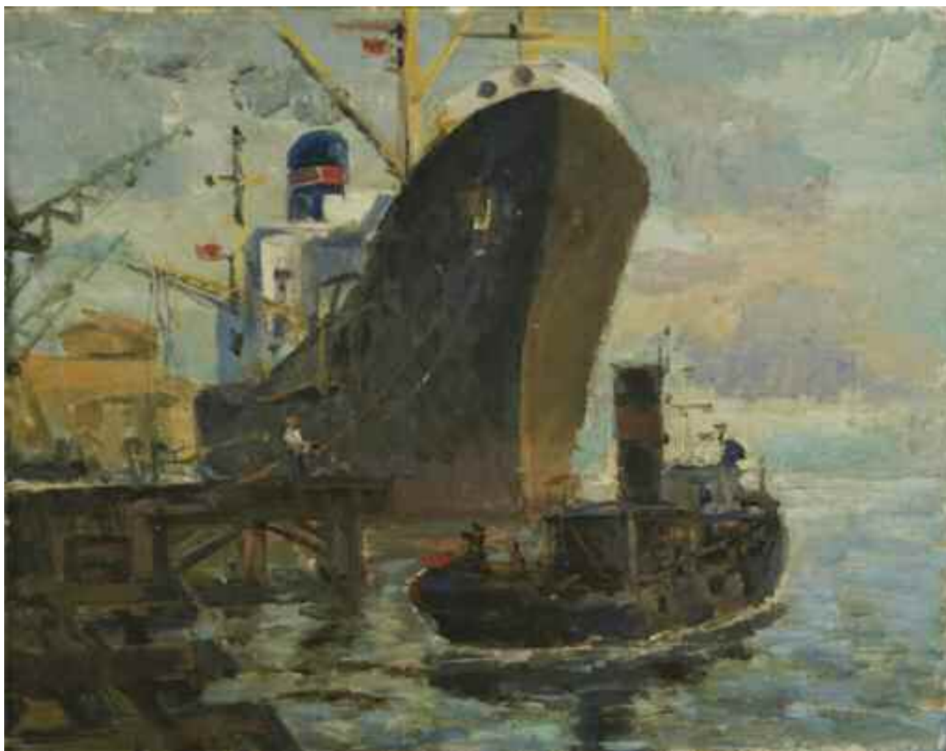
СТРЕЛЬНИКОВ В. В. «Старий порт», 1971 р. картон, олія; 32,5 см х 41 см; підпис на звороті