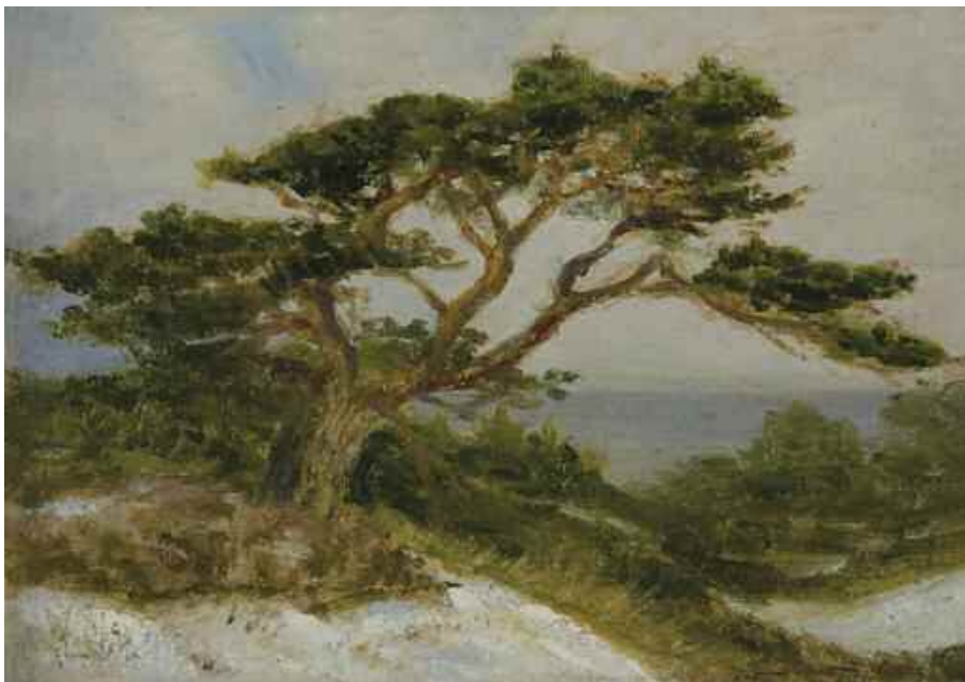
АЛЕКСАНДРОВИЧ В. «Морський краєвид», I пол. XX ст. картон, олія; 18 см x 25 см; підпис і дата знизу ліворуч