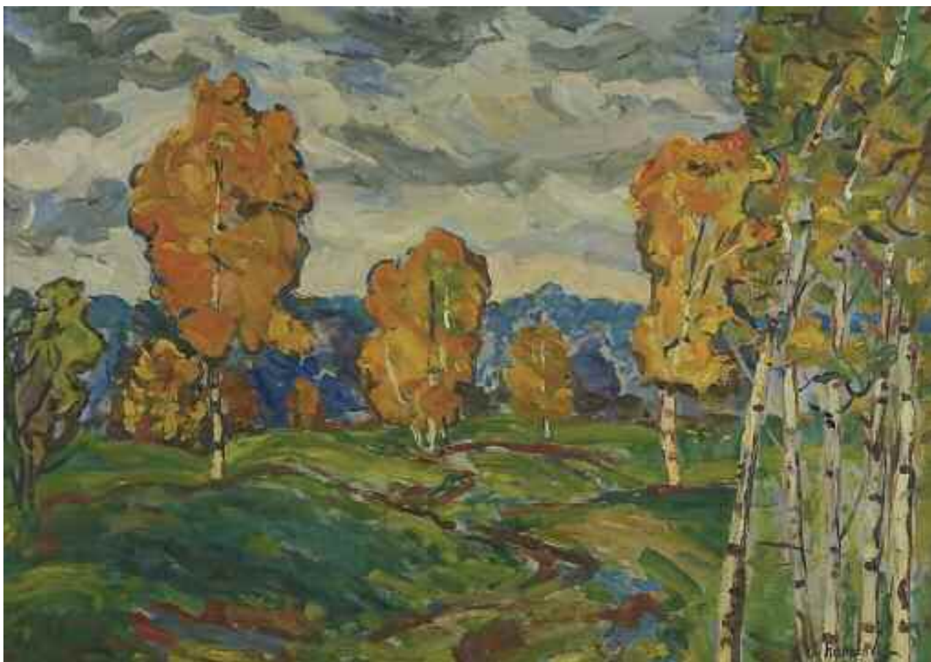
КОЛОСОВСЬКИЙ Г. С. «Хмарне небо», II пол. XX ст. картон, олія; 45,5 см x 61,5 см; підпис знизу праворуч