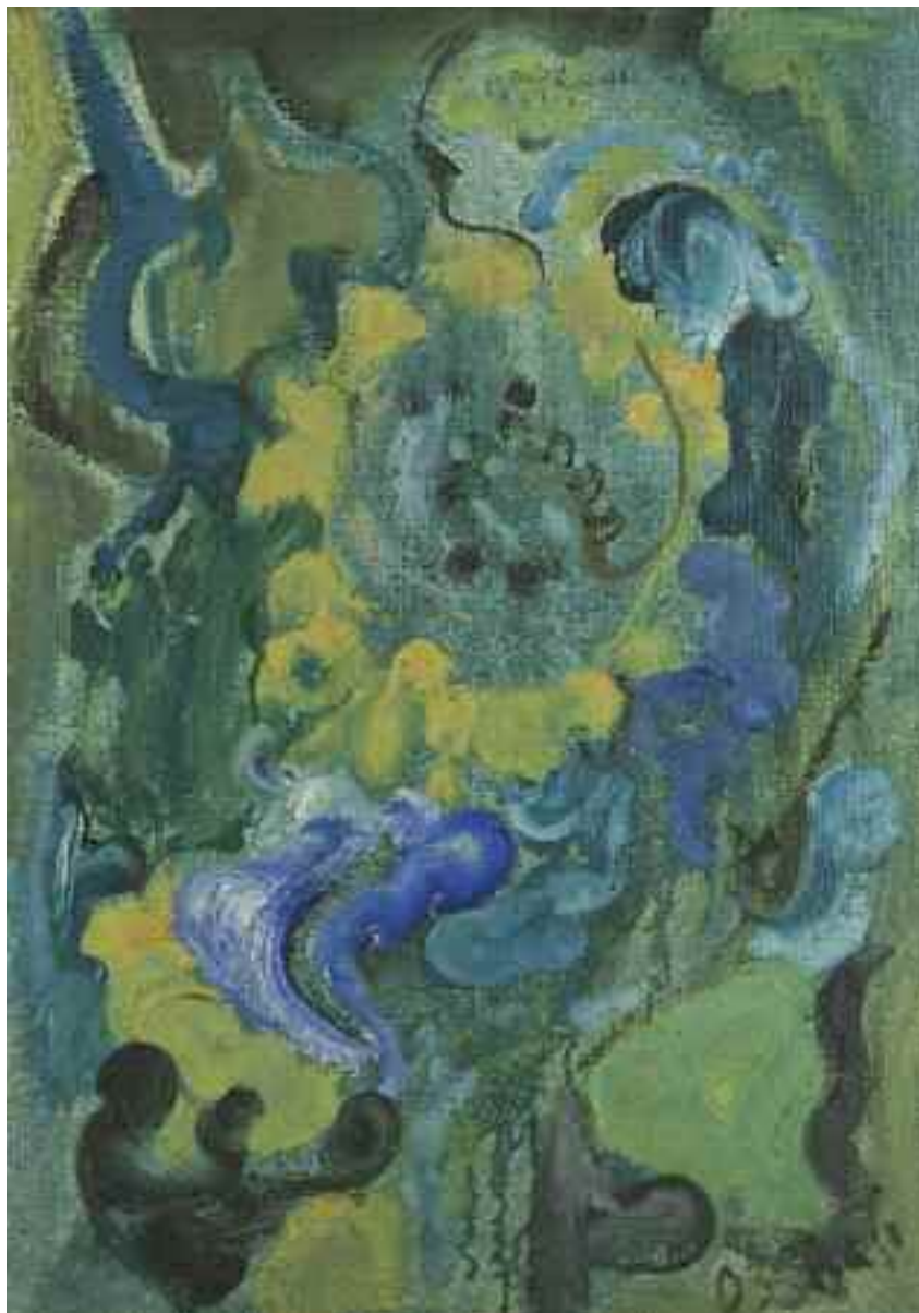
СЕМАН Ф. «Композиція. Квіти», кін. XX ст. полотно, олія; 68 см x 47,5 см; підпис знизу праворуч Робота опублікована в «Каталозі виставки творів Семана Ференца Закарпатського обласного музею ім. Й. Бокшая»