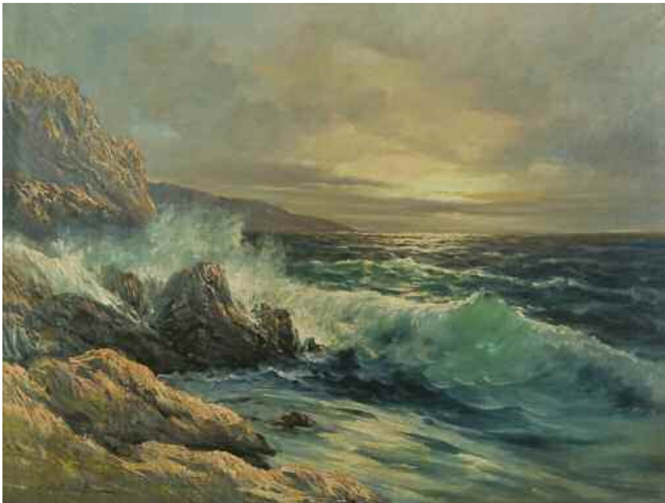
ВЕЩІЛОВ К. О. «Аю-Даг», II чверть XX ст. полотно, олія; 60 см x 80 см; підпис знизу ліворуч Експертний висновок Распопіної В.А.