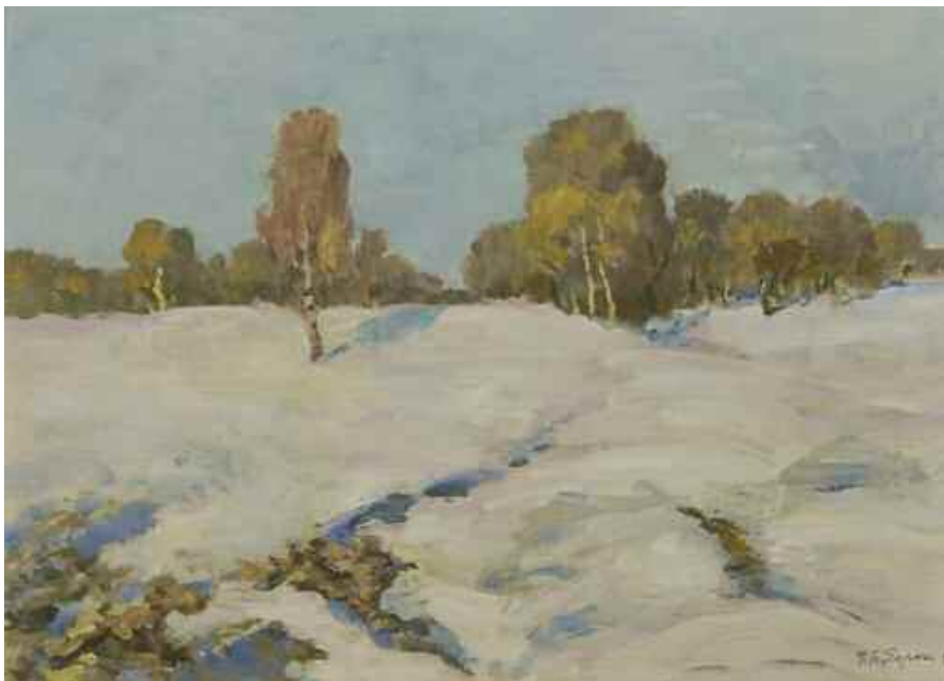
БРЕДЮК П. Ф. «Весняне сонце», II пол. XX ст. картон, олія; 35 см x 48 см; підпис знизу праворуч