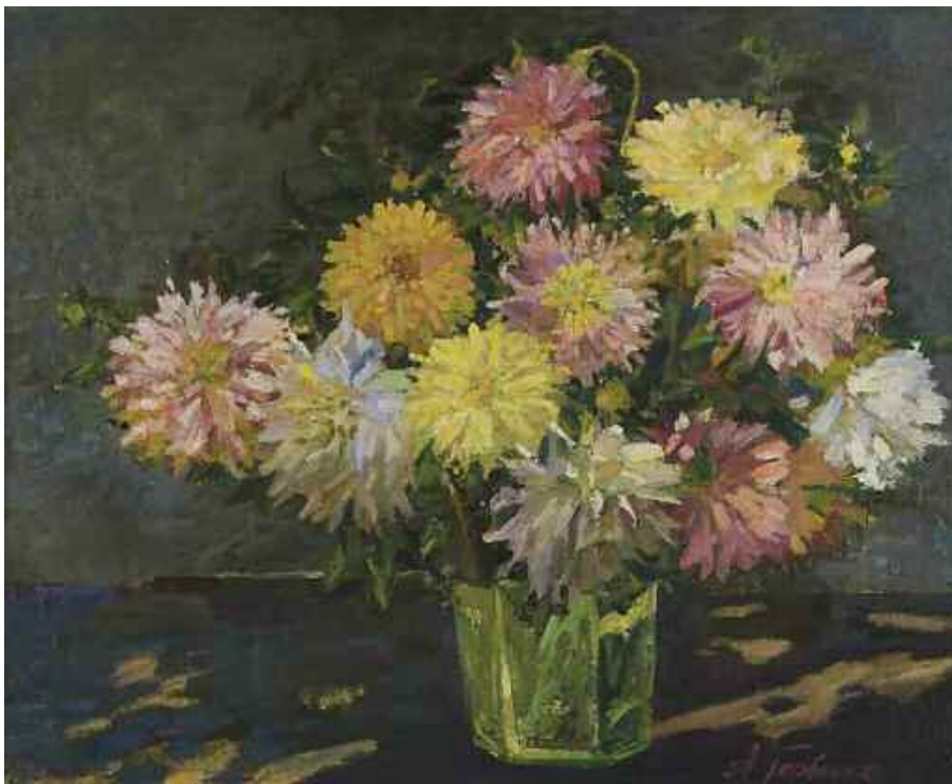
ГОРБЕНКО О. А. «Букет квітів», II пол. XX ст. картон, олія; 65 см x 79 см; підпис знизу праворуч