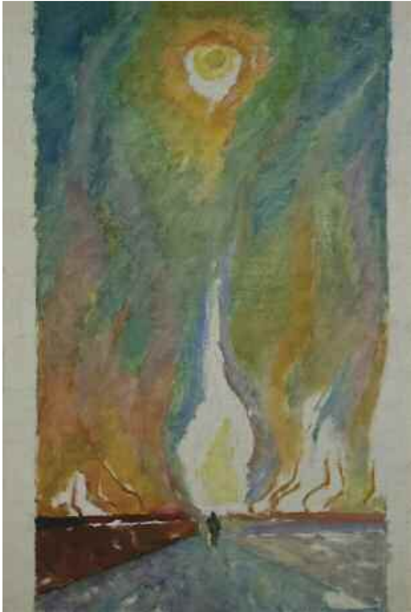
БОНЯ Г. В. «Між небом і землею», 1970-і рр. полотно, олія; 65 см x 45 см; підпис знизу ліворуч