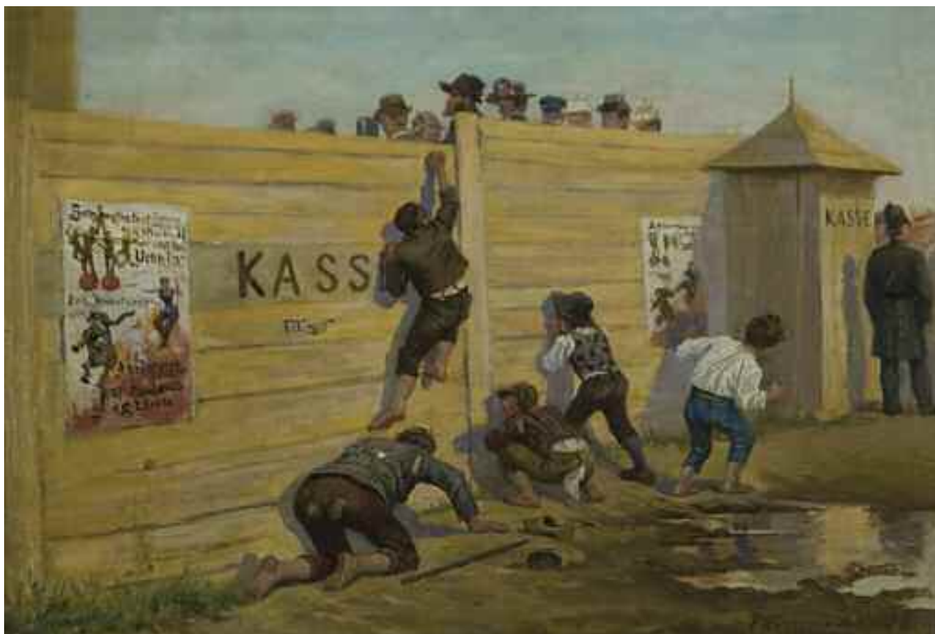
МАЗУРОВСЬКИЙ В. В. «Цирк приїхав», 1892 р. дерево, олія; 16 см x 23,5 см; підпис і дата знизу праворуч