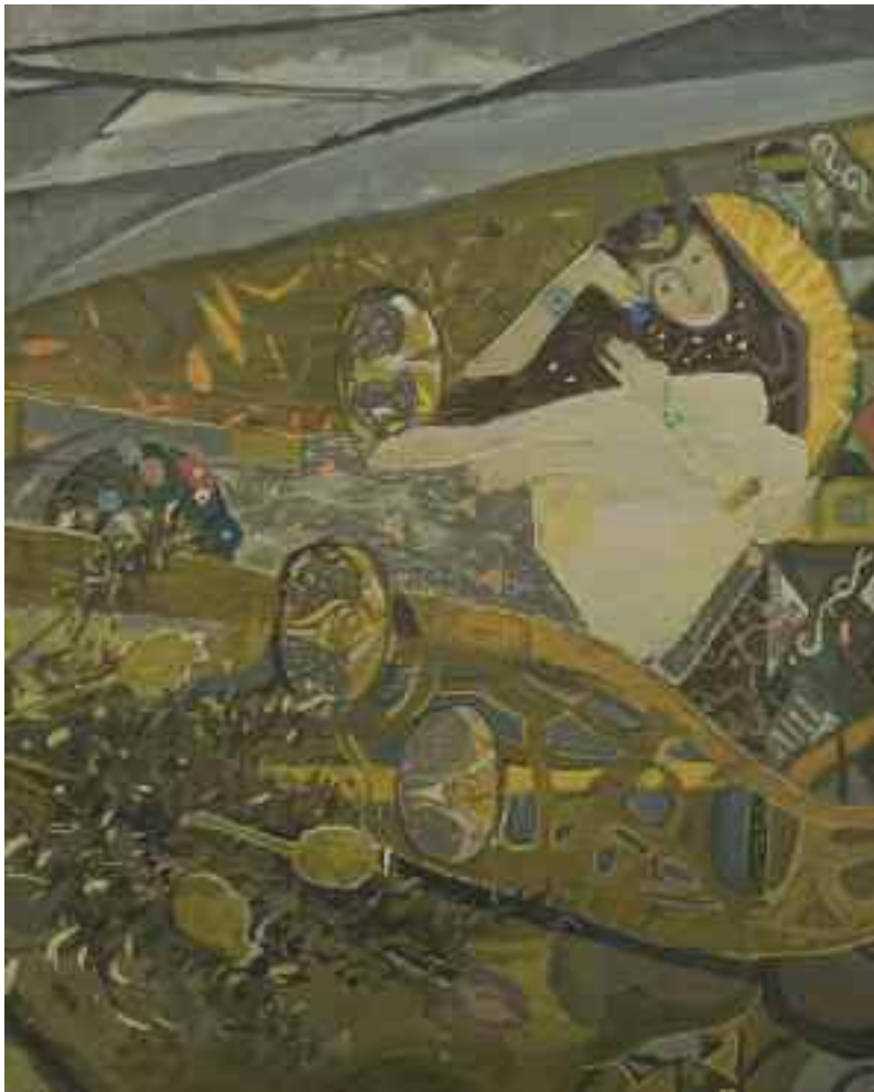
ЗАРЕЦЬКИЙ В. І. «Лісова мавка», 1980-і рр. картон, темпера; 68,5 см x 55 см; підпис знизу ліворуч Експертний висновок Д. Горбачова