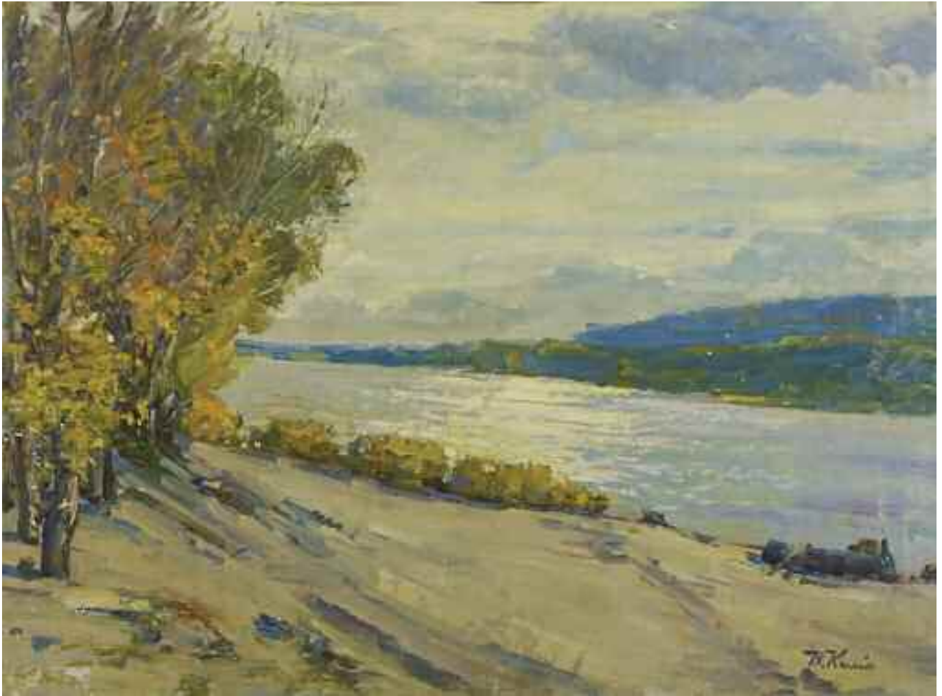
КИСІЛЬ І. Г. «На березі», 1970-і рр. полотно, олія; 60 см х 80 см; підпис знизу праворуч