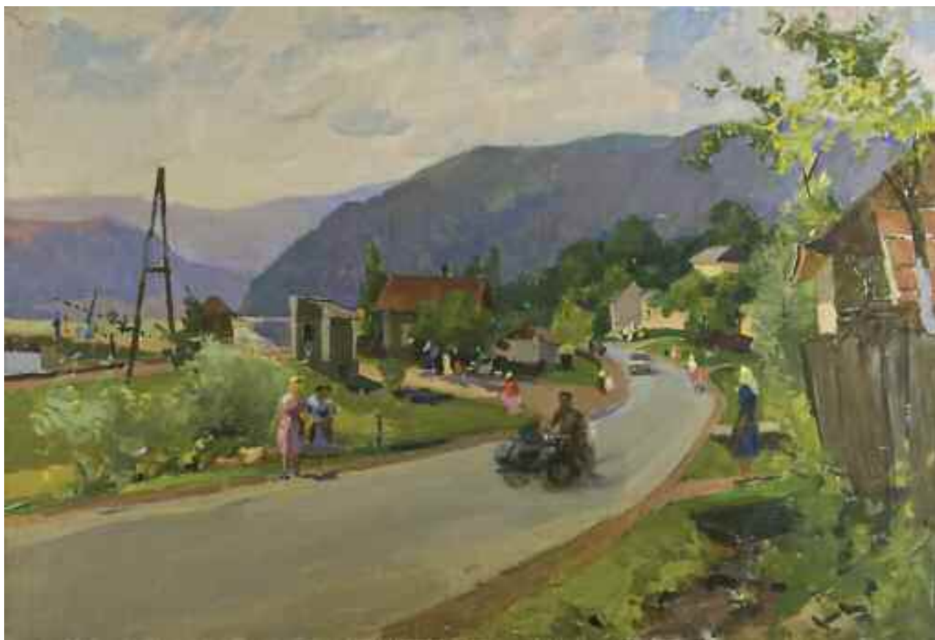
КОБИЛЕНКОВ М. В. «Дорога край села», кін. ХХ ст. полотно, олія; 68,5 см x 100 см; підпис на звороті