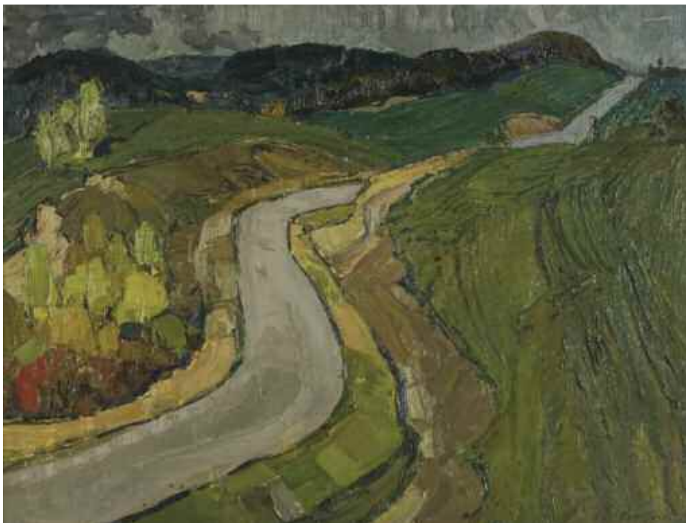
ПЕТРОВИЧЕВ П. І. «Дорога» , I пол. XX ст. полотно, олія; 50 см х 65,5 см; підпис знизу праворуч Експертний висновок Распопіної В.А.