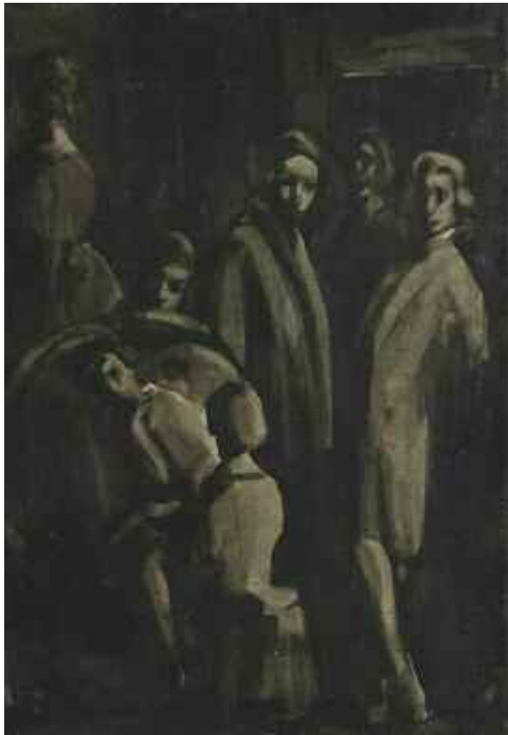
ГЛЮКМАН Г. Ю. «Манон Леско», II чв. XX ст. полотно, олія; 41,5 см x 29,5 см; підпис на звороті Експертний висновок Распопіної В.А.