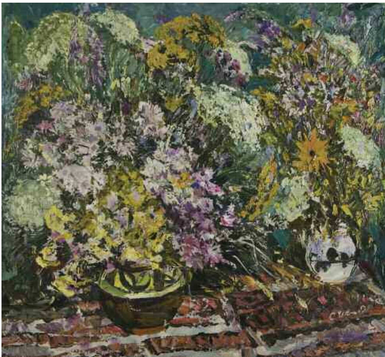
ШАПОВАЛОВ С. Г. «Натюрморт», II пол. XX ст. полотно, олія; 70,5 см x 75,5 см; підпис знизу праворуч