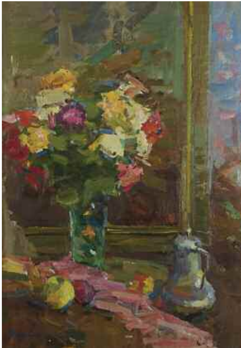
ЗАХАРОВ Ф. З. «Натюрморт із трояндами», 1980-і рр. картон, олія; 70 см x 49,5 см; підпис знизу ліворуч Експертний висновок Цитовича В.І.