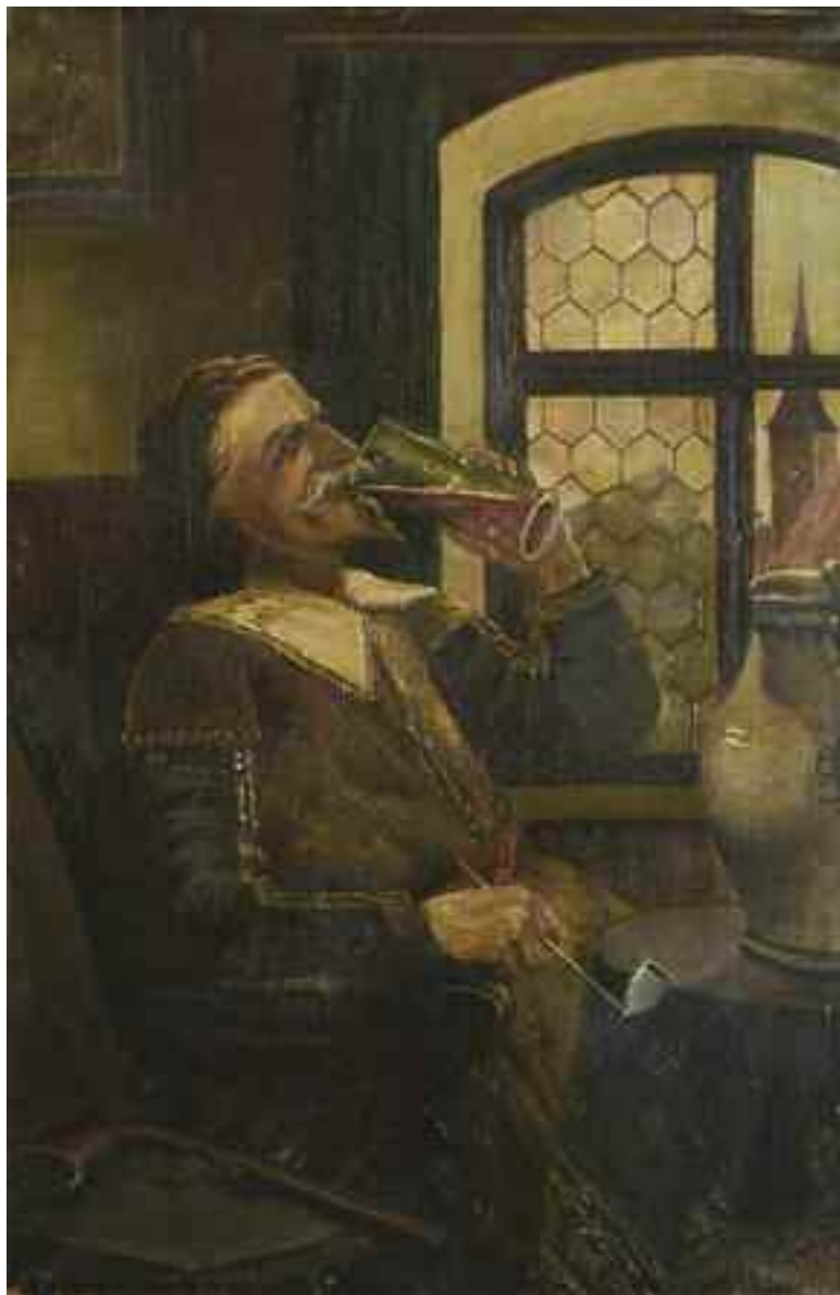
ЛІНДЕ В. «У світлиці», I пол. XX ст. полотно, олія; 64 см x 41 см; підпис знизу праворуч