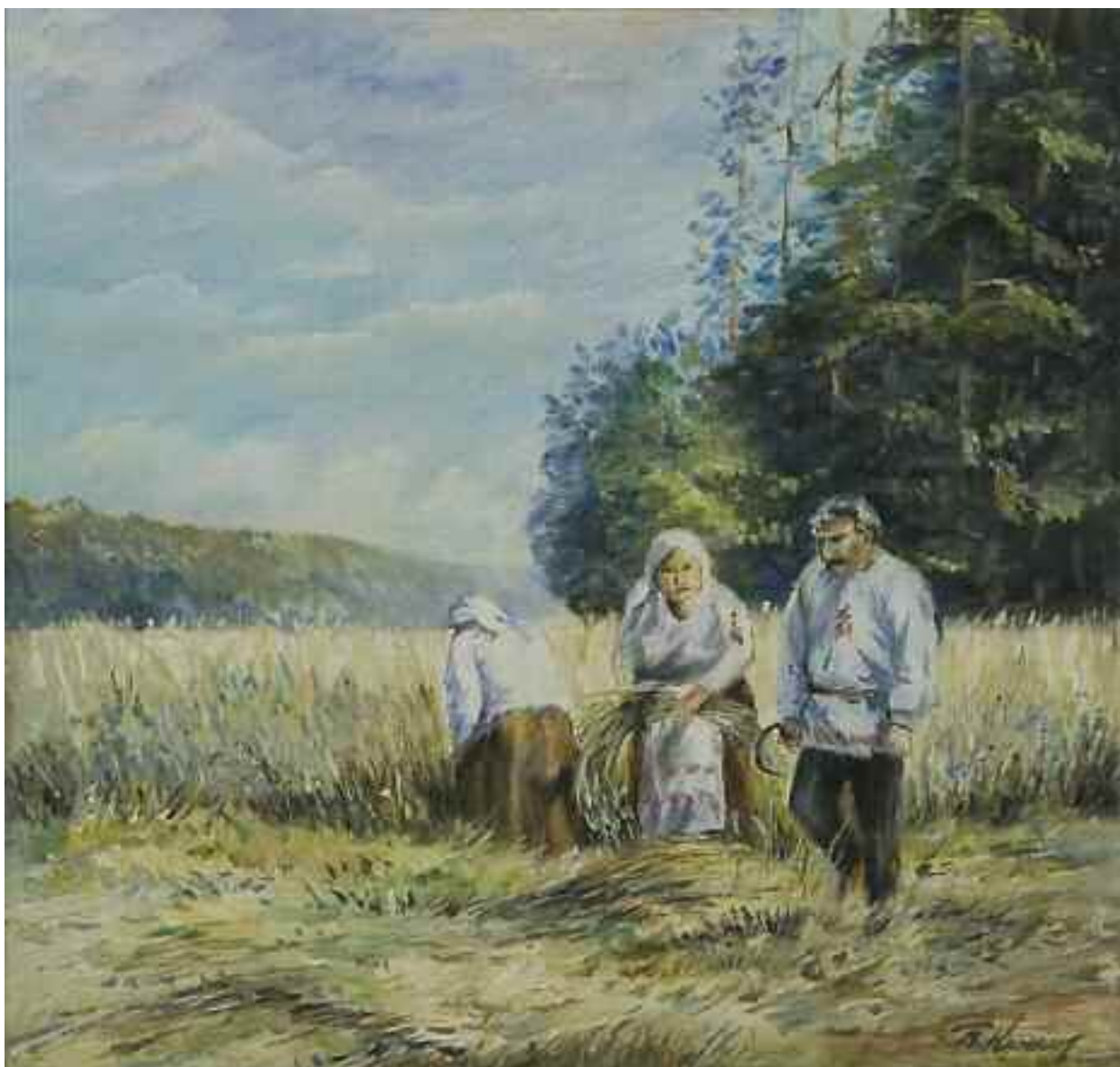
КРИЛОВ П. М. «Жнива», II пол. XX ст. картон, олія; 41 см х 43,5 см; підпис знизу праворуч