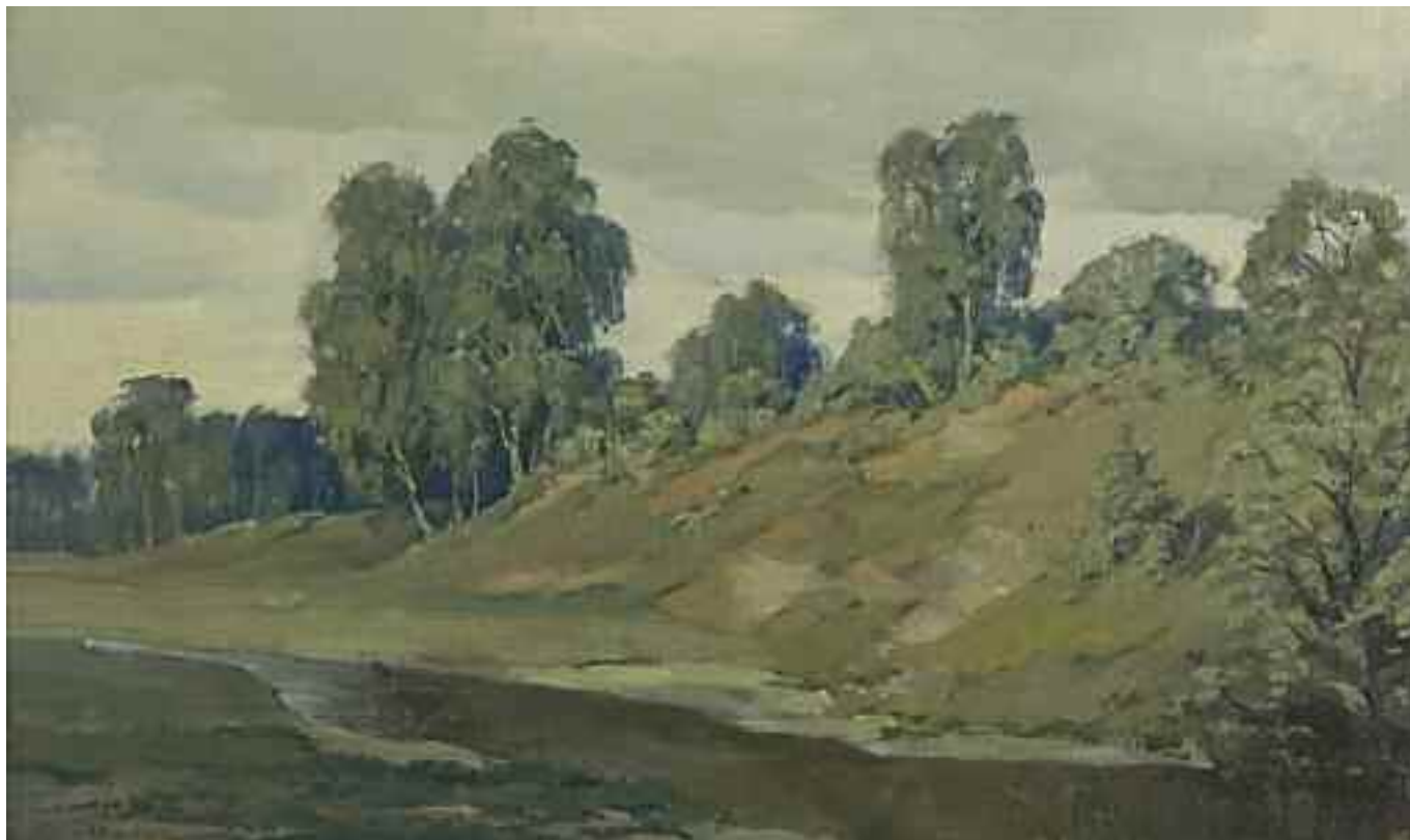
КАМЗОЛКІН Є. І. «Дерева над рікою», 1940-і рр. полотно, олія; 33 см x 55 см; підпис знизу ліворуч Експертний висновок Распоїної В.А.