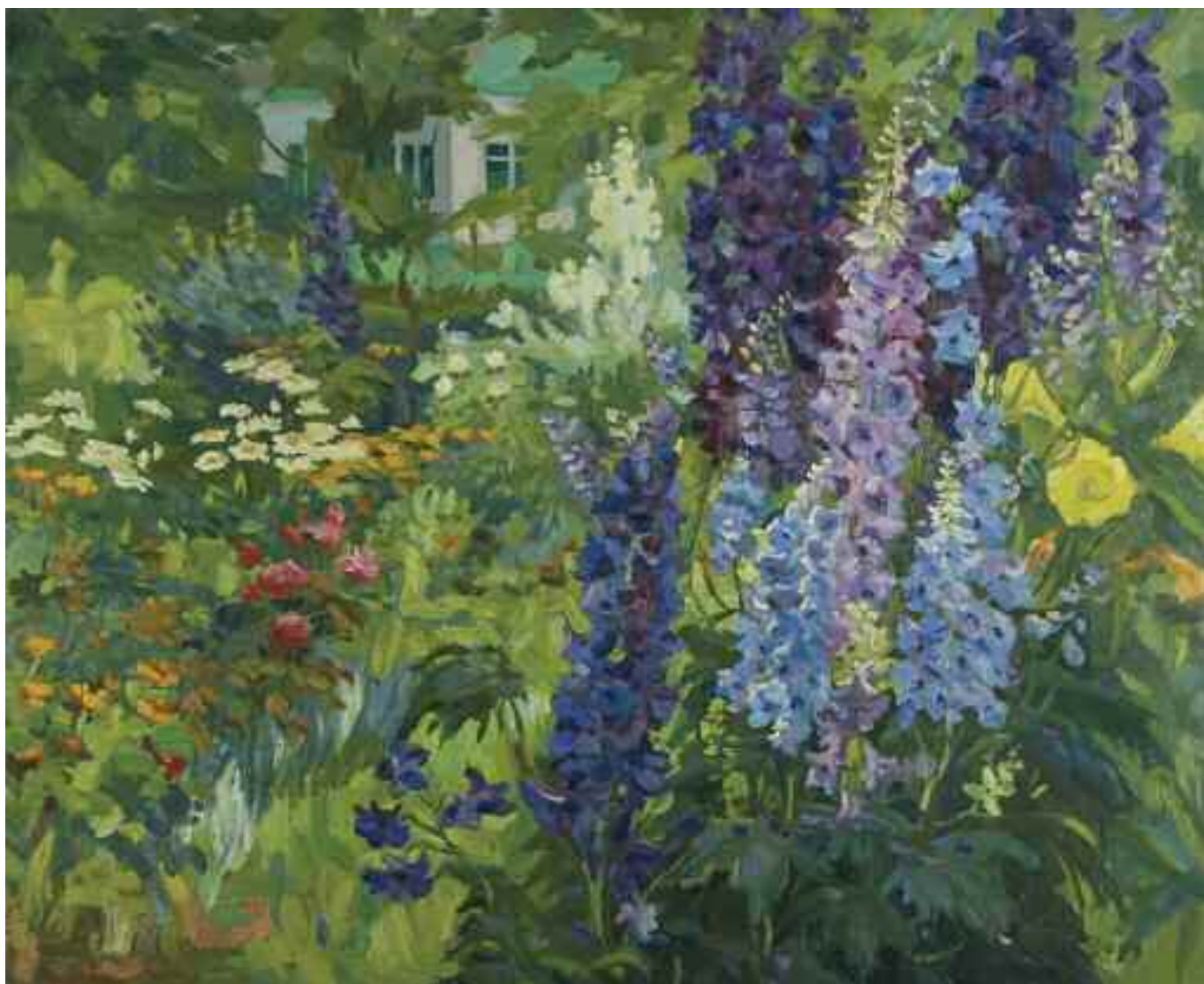
ЗОРЯ Г. Д. «Квітучий сад», II пол. XX ст. картон, олія; 87 см x 105 см; підпис знизу праворуч