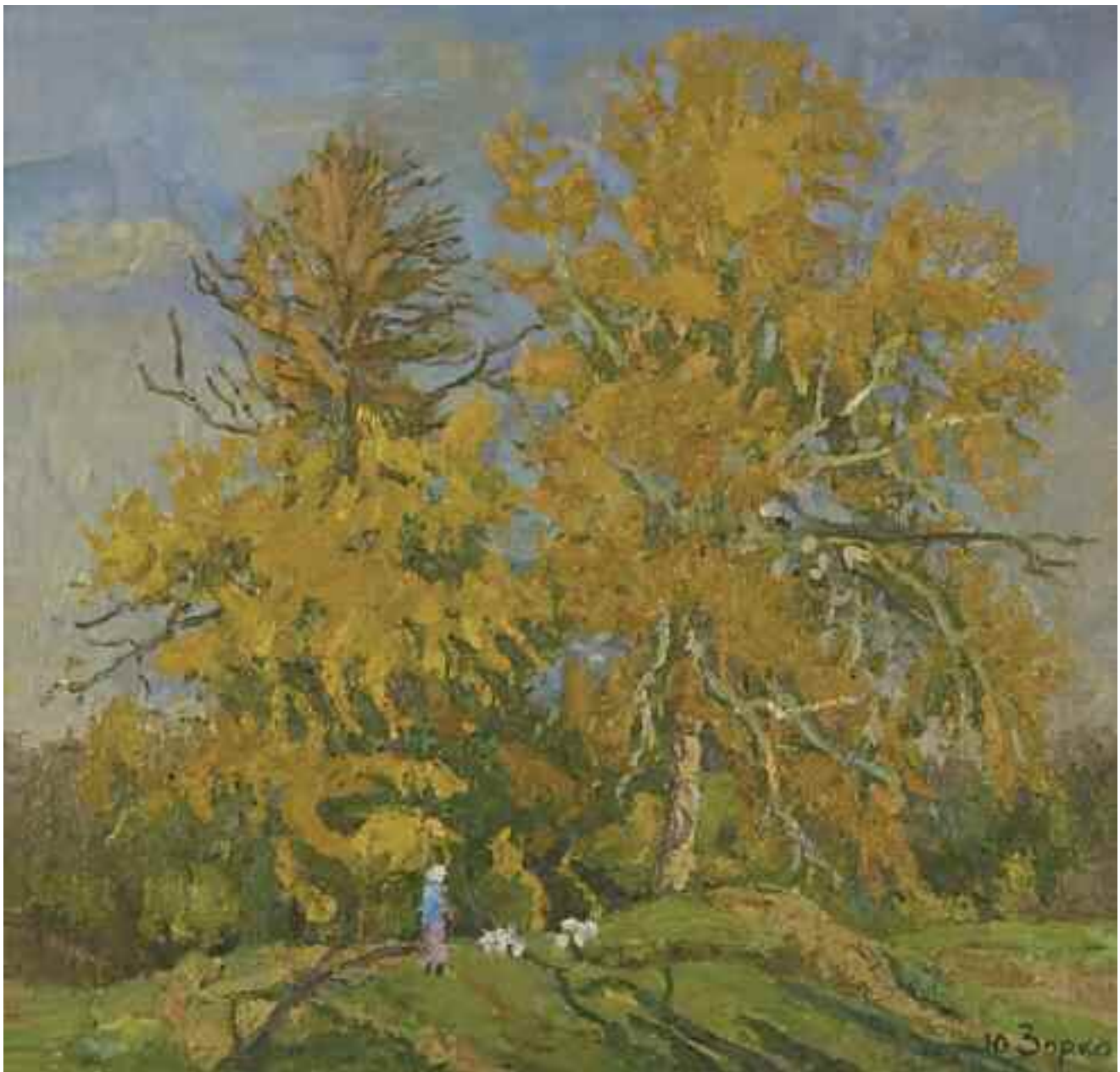
ЗОРКО Ю. В. «Теплий день», II пол. XX ст. полотно, олія; 60 см x 55 см; підпис знизу праворуч