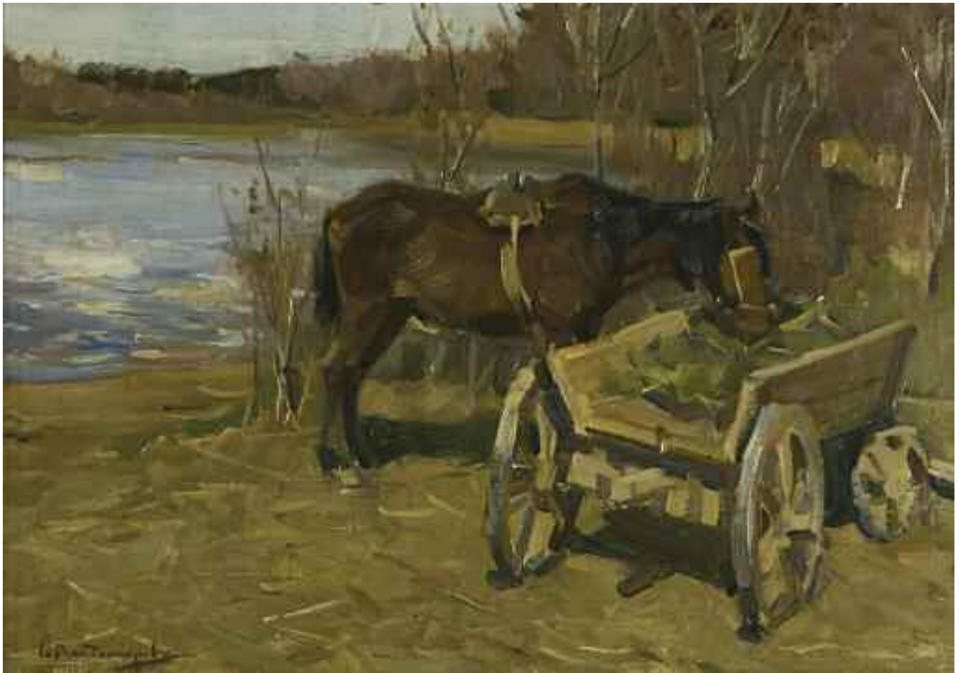
ВЛАДІМІРОВ І. О. «Кінь біля воза», 1908 р. полотно, олія; 36 см x 51 см; підпис знизу ліворуч Експертний висновок Распопіної В.А.