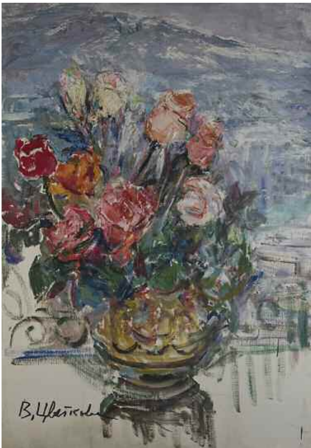
ЦВЕТКОВА В. П. «Ялтинські троянди», 2005 р. полотно, олія; 100 см x 70 см; підпис знизу ліворуч Експертний висновок Цитовича В.І.