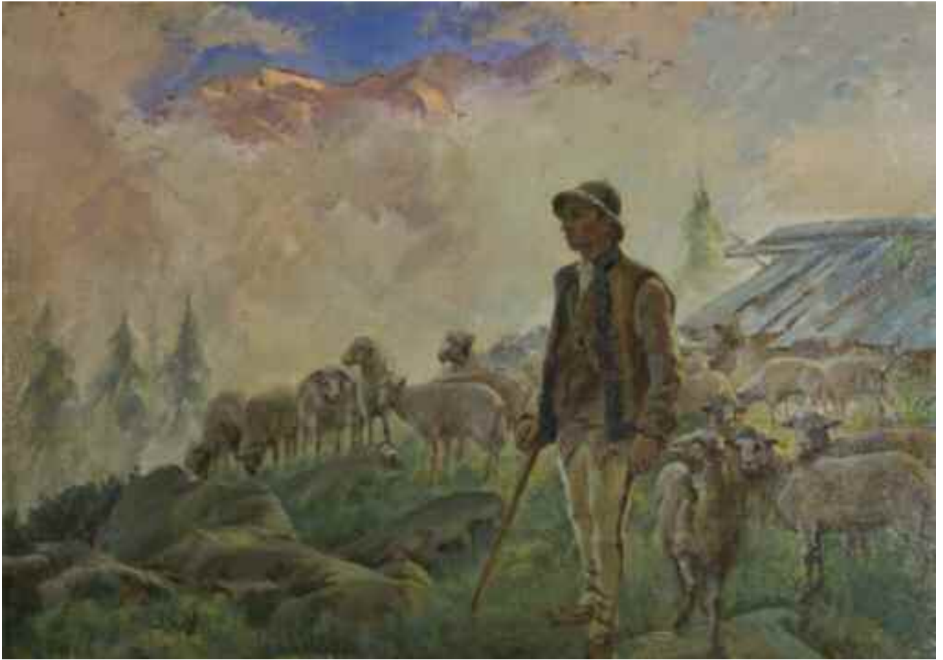
МАЛЕЄВ Я. «Пастушок на полонині», 1930-і рр. картон, олія; 50 см x 70 см; підпис знизу праворуч