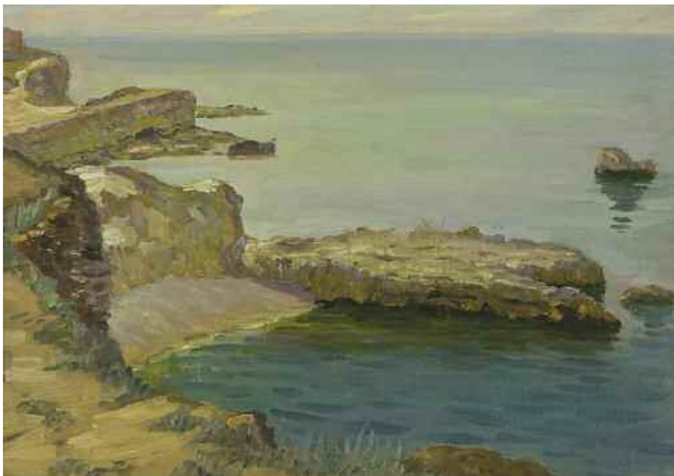
КОЛОМОЙЦЕВ П. М. «Море», II пол. XX ст. полотно, олія; 50 см x 70 см; підпис на звороті