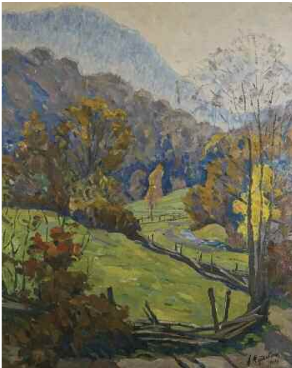
МОРДОВЕЦЬ А. М. «Вечір у Карпатах», 1997 р. картон, олія; 70 см х 56 см; підпис і дата знизу праворуч