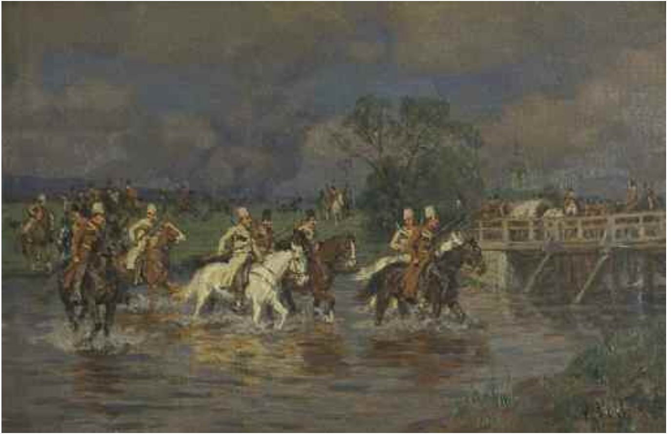
ВЕЛЬТЕН В. «На переправі», кінець ХІХст. дерево, олія; 16,5 см x 24,5 см; підпис знизу праворуч Експертний висновок Распопіної В.А.