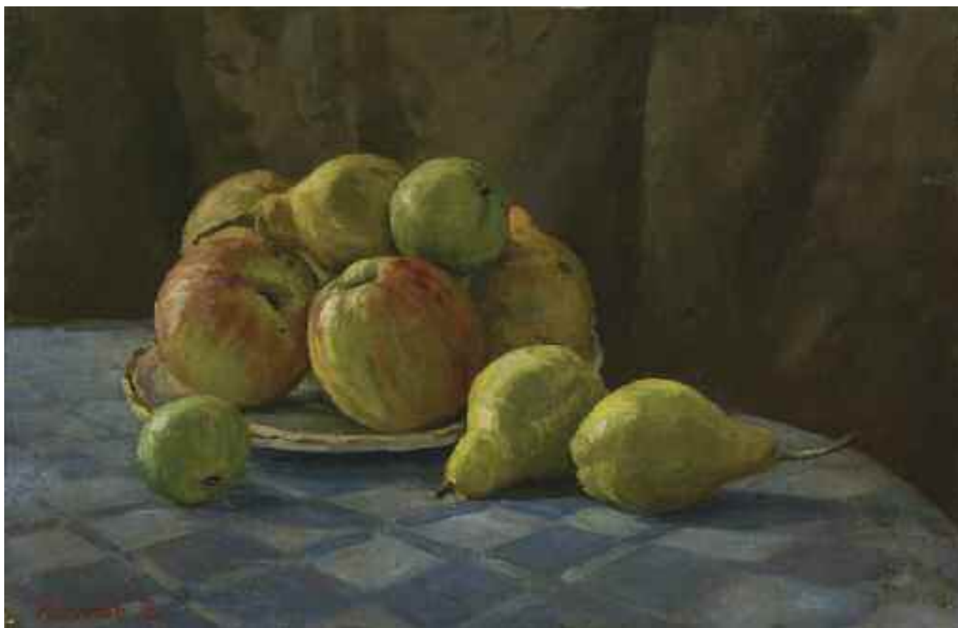
ЕГОРОВ Б. К. «Натюрморт із фруктами», II пол. XX ст. полотно, олія; 39,5 см x 59,5 см; підпис знизу ліворуч