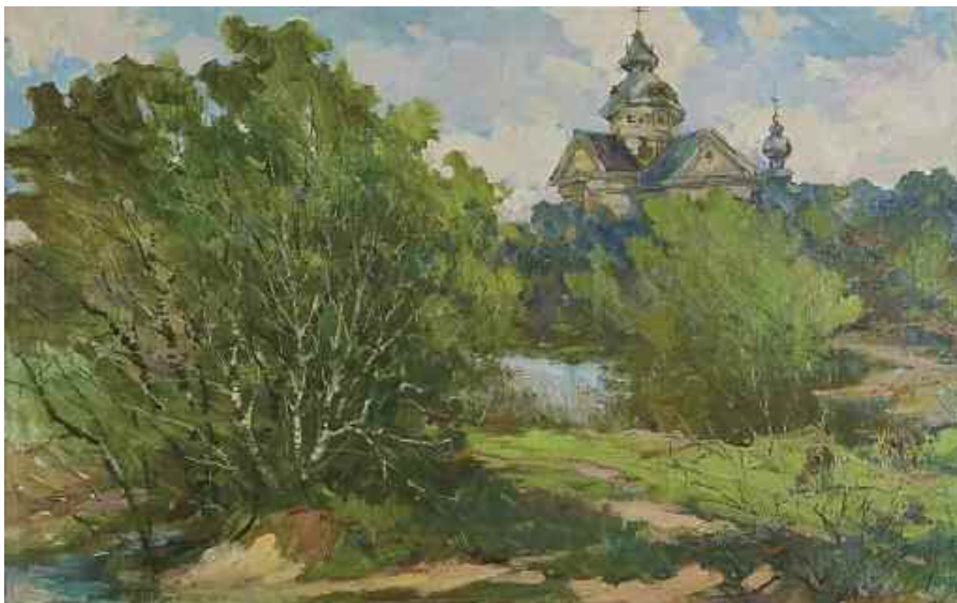
МАЛЬЦЕВ М. О. «Вид на фортецю», 1995 р. полотно, олія; 49 см x 77 см; підпис і дата знизу ліворуч