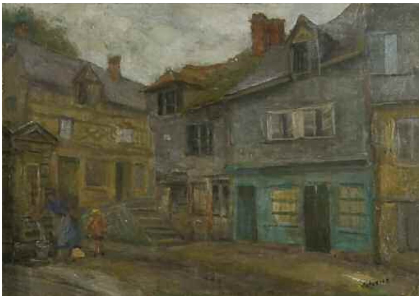
ВОЛОВИК Л. «Дворик», сер. XX ст. полотно, олія; 33 см х 46 см; підпис знизу праворуч