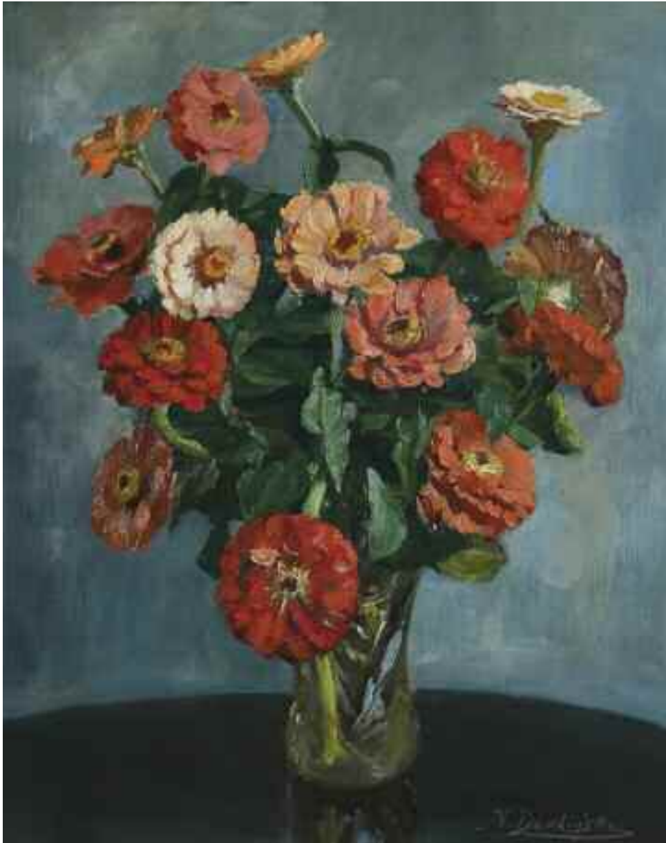
ДЗЕЛІНСЬКИЙ Я. К. «Цинії», I пол. XX ст. картон, олія; 55 см x 44 см; підпис знизу праворуч