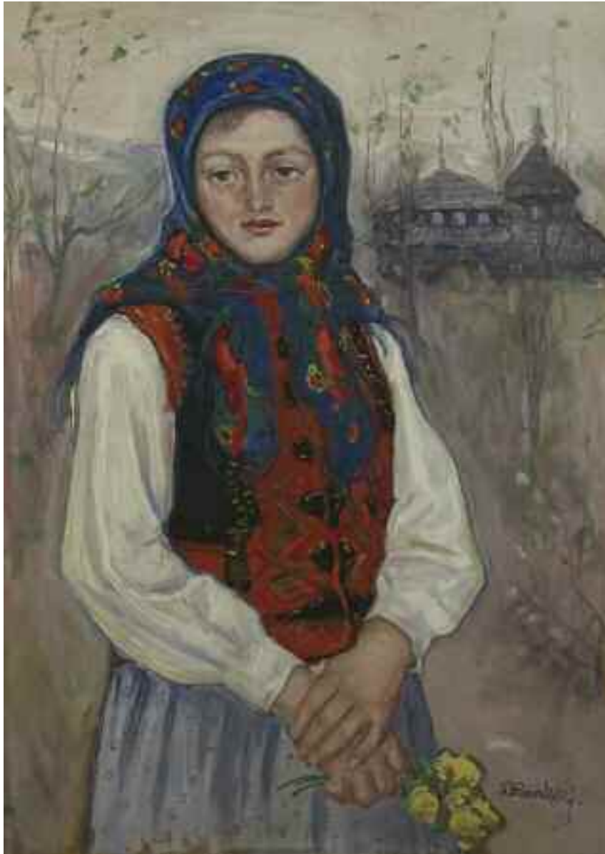
КОВАЛЬСЬКИЙ Л. «Дівчина з букетом квітів», I пол. XX ст. картон, олія; 70 см x 50 см; підпис знизу праворуч