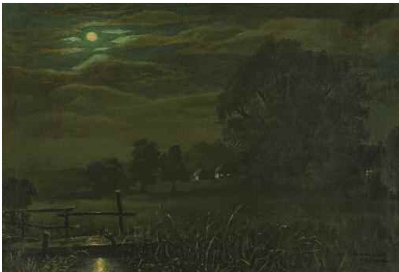
ПАШКОВСЬКИЙ М. В. «Місячна ніченька», 1971 р. полотно, олія; 70 см x 100 см; підпис і дата знизу праворуч