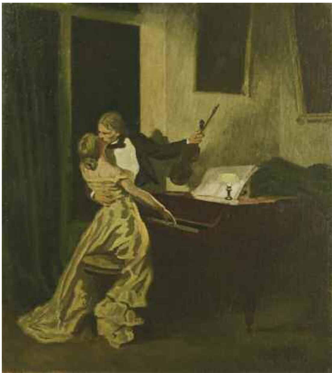
РОЙЛІ А. «Поцілунок», I пол. XX ст. картон, олія; 55 см x 44 см; підпис знизу праворуч